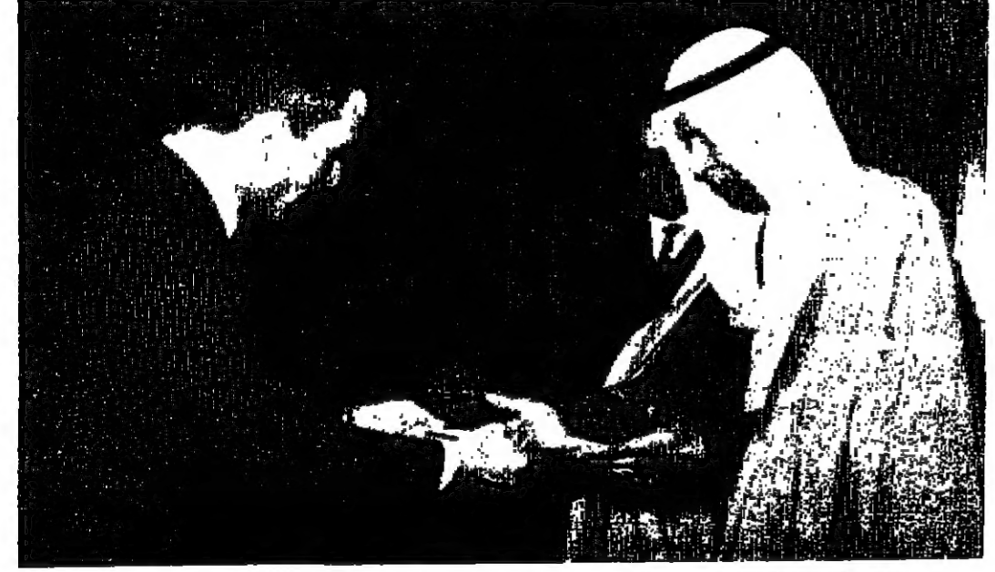
جلالة الملك المعظم يتسلم رسالة سمو امير الكويت من السيد ابراهيم الشطي

عمان - تسلم الاردن ثلاث طائرات من كويتية مهداة الى جلالة الملك الحسين المعظم من سمو اخيه الشيخ صباح السالم الصباح امير دولة الكويت . وقد وصلت الطائرات الثلاث الى مطار عمان المنسي صباح امس وعلى متن احداهما مبعوث سمو امير دولة الكويت السيد ابراهيم الشطي نائب كبير امراء الديوان الاميري . واجرى في المطار احتفال بتسلم الطائرات الثلاث حضره السيد امين بونسي الحسيني وزير النقل والاسواق ابراهيم عمان مدير شركة عمالة - الخطوط الجوية الملكية الاردنية - والسيد عامر شحوط مدير المراسم في وزارة الخارجية والقائم باعمال السفارة البقية على صفحته ٥ عمود ٥